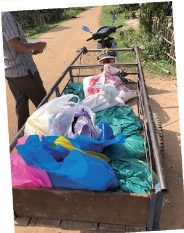
派送給同學的禮物

其間，我們有幸能跟政府官員介紹「牽手」計劃，並分享神的愛。他們回應說，此計劃使村民感動，因能幫助解決孩子提早輟學問題。而團隊亦能在當地成為典範，鼓勵更多年輕人起來服侍自己社區。我們為計劃能獲得各方認同，而感到很欣慰。