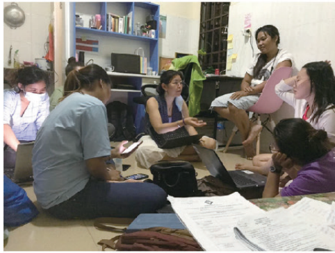
團隊為行程努力準備